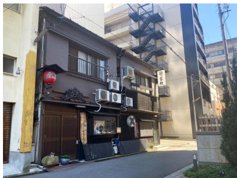
松山市中心で50年に渡り営業されてきた一品料理のお店です