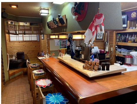
入ってすぐ小綺麗にまとまっているカウンター（8～12席）。